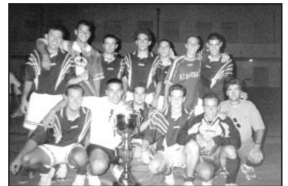
El equipo campeón del maratón de fútbol-sala.