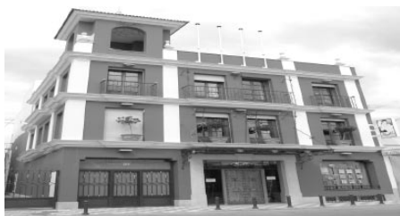
C/. La Fuente, 26

Rogamos a nuestros anunciantes, nos comuniquen, cuando dejamos de insertar sus ofertas, o las suprimiremos discrecionalmente.