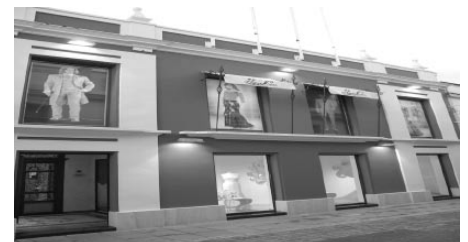
C/. Portales, 4 Tlf. 957 63 86 88